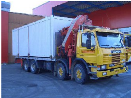
Transport par route