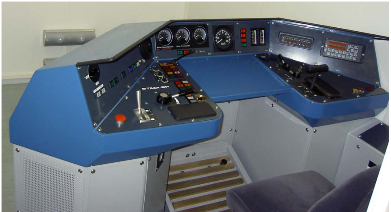
Pupitre de commande Base: rame à plancher bas du chemin de fer Matterhorn-Gotthard