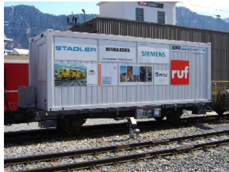
Transport par fer (Chemin de fer rhétique)