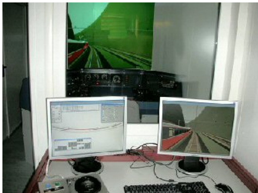
Emplacement de l'instructeur