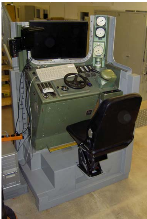
Pupitre de commande d'une voiture de commande du RBS