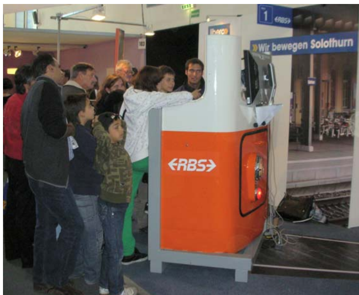
Utilisation lors de la foire d'automne de Soleure HESO 08 Succès garanti des simulateurs auprès du public